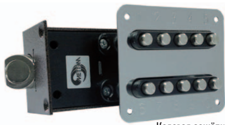
Кодовая защёлка МЕТТЭМ®

Отечественные замки МЕТТЭМ® известны покупателям и дверным компаниям уже более 20 лет. Прежде всего, это замки с надежным сувальдным механизмом секретности, работу которого по точности можно сопоставить с устройством дорогих часов. Однако наиболее распространенным изделием компании по праву считается кодовая защёлка, ее можно увидеть на двери любого подъезда или склада. Сейчас это трудно поверить, но сотрудники ЗАО «МЕТТЭМ-Производство» еще помнят, как в 90-х покупатели выстаивались в очередь и с ночи дежурили у дверей офиса МЕТТЭМ® в Балашихе, чтобы успеть купить этот чудо-замок. Кодовая защёлка не утрачивает своей популярности и по сей день благодаря широкому спектру возможностей применения модели, тем не менее конструкторам завода есть что предложить потребителям и помимо кодового замка. ↵