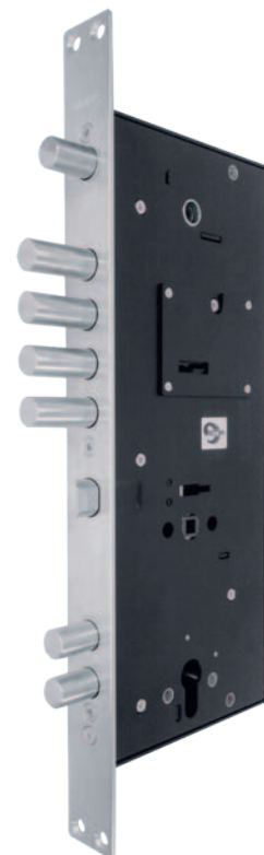
Моноблок с защитными пластинами

ЗАО «МЕТТЭМ-Производство» — одна из немногих компаний, производящих изделия на заказ. По индивидуальным чертежам и размерам заказчика конструкторы могут сделать любой замок или любой ключ. Зная об этом, за помощью в