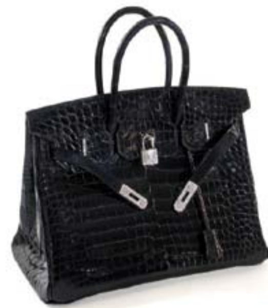
иллюстрация к вопросу № 13 по горизонтали

По вертикали: 1. Сирена. 2. «Эврика». 3. Хакер. 4. Бородка. 5. Щеколда. 6. Англия. 7. Отжим. 8. Взлом. 9. Твиттер. 10. ...замке.